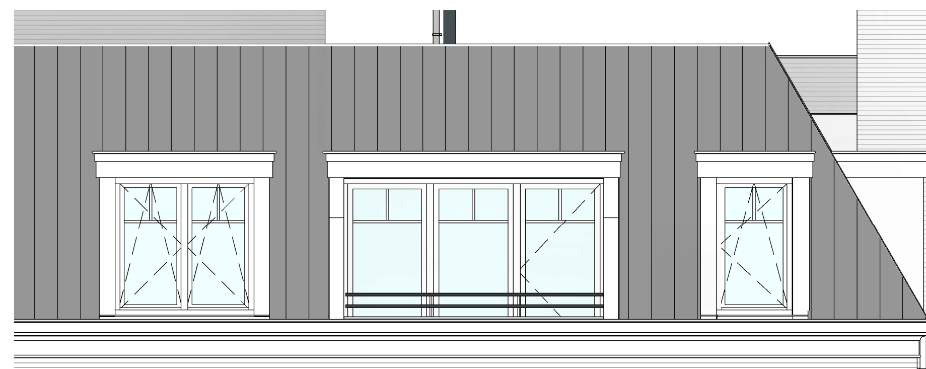
Voorgevel bouwnummer 62