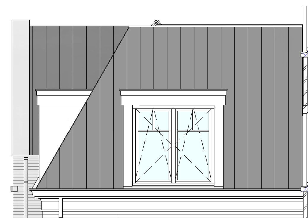
Zijgevel bouwnummer 62